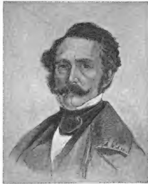
William Thomas Green Morton.

F. von Graefe (1787—1840; partielle Resektion des Unterkiefers, Unterbindung des Truncus anonymus, Wiederbelebung der plastischen Operationen, Studien über Angiektasien, ägyptische Augenkrankheit, Gaumennaht, Lithotripsie, Erfinder des Compressoriums der Meningealarterien, des Ligaturstäbchens), Johann Friedrich Dieffenbach (1792—1847). Professor in Berlin, einer der grössten Chirurgen aller Zeiten, der der Schöpfer der modernen plastischen Chirurgie genannt werden kann («Chirurgische Erfahrungen, besonders über die Wiederherstellung zerstörter Teile des menschlichen Körpers nach neuen Methoden» Berlin 1829 bis 1834), auch die Lehre von der Bluttransfusion bedeutend gefördert hat, die Methode der subkutanen Tenotomie ver-